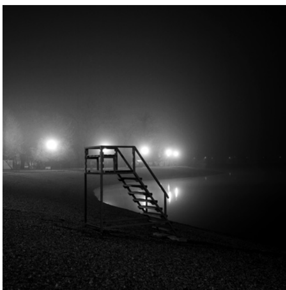
Jarunska obala I (Jarun)