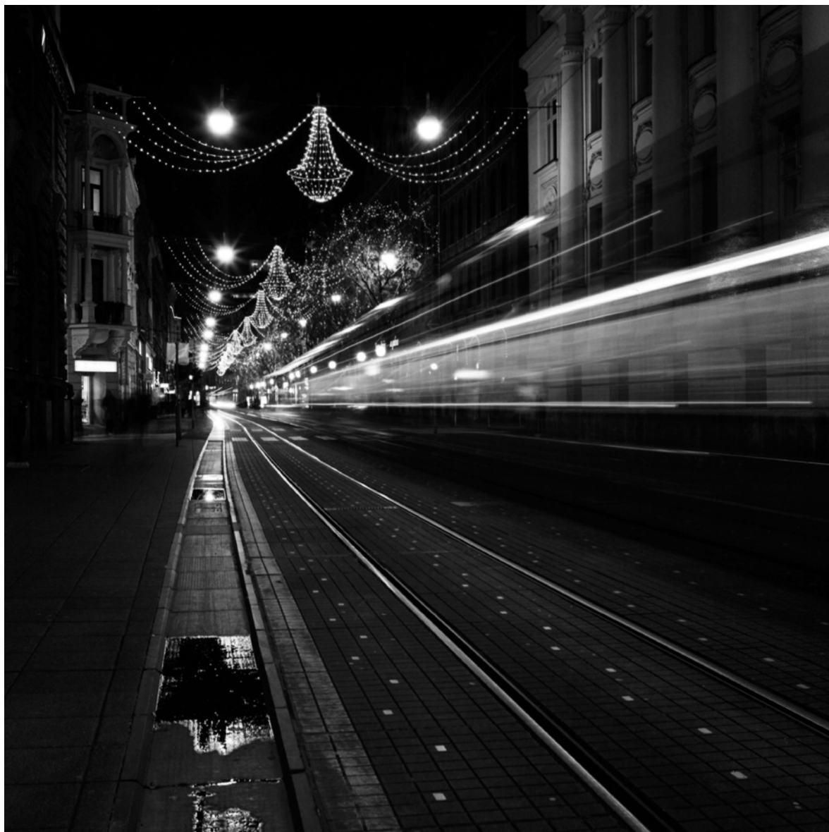
Brzina (Jurišičeva ulica)