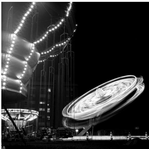
Lunapark (Dubrava, Poljanice)