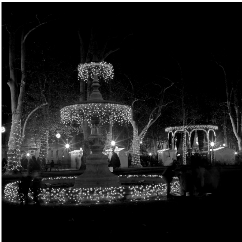
Fontana (park Zrinjevac)