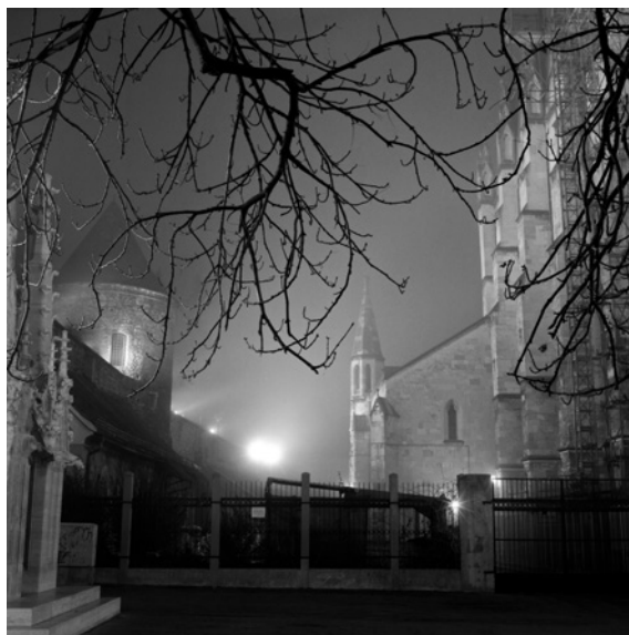
Pogled na katedralu (Kaptol)