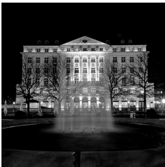
Hotel Esplanada (Trg Ante Starčevića)