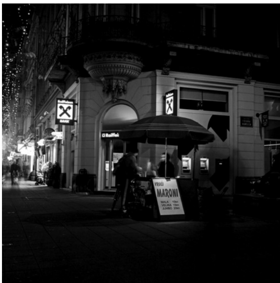
Kestenjara (Jurišićeva ulica)