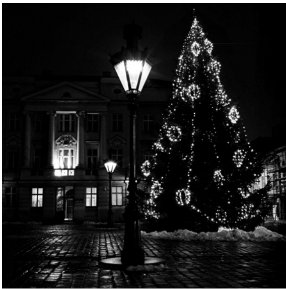
Hrvatski sabor (Trg svetog Marka)