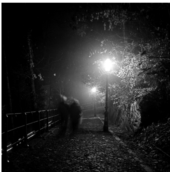
Silazak (Strossmayerovo šetalište)