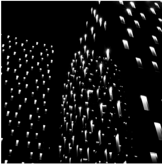
Osvjetljena zgrada (Strojarska ulica)