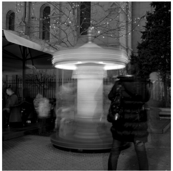
Vrtoglavica (Cvjetni trg)