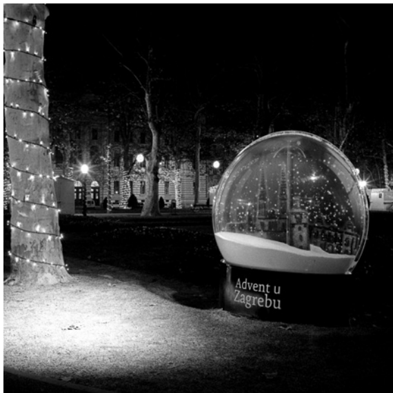
Advent u Zagrebu (park Zrinjevac)