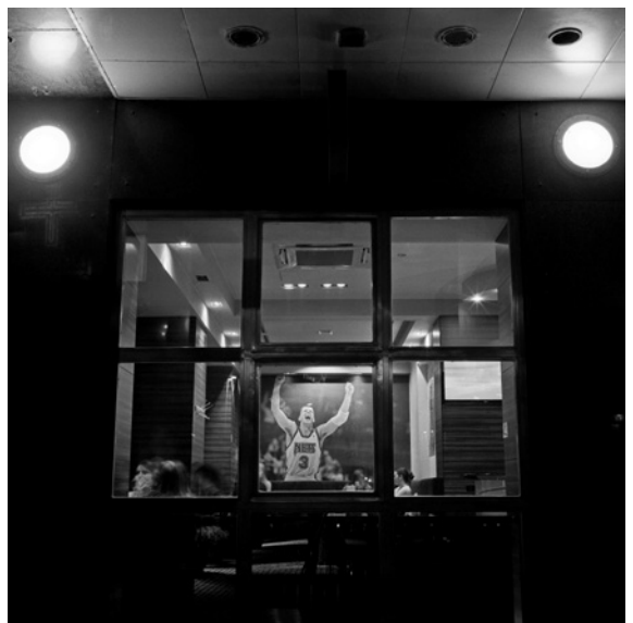
Dražen Petrović (Cibonin prolaz)