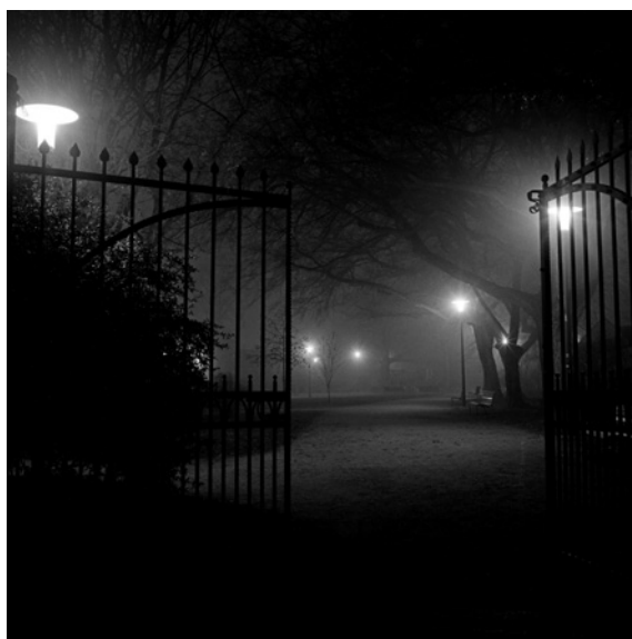
Tajni vrt (park na Opatovini)