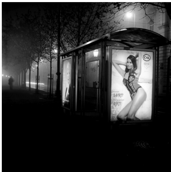
Tramvajska stanica (Praška ulica)