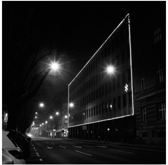
Zgrada Elektre (Hebrangova ulica)