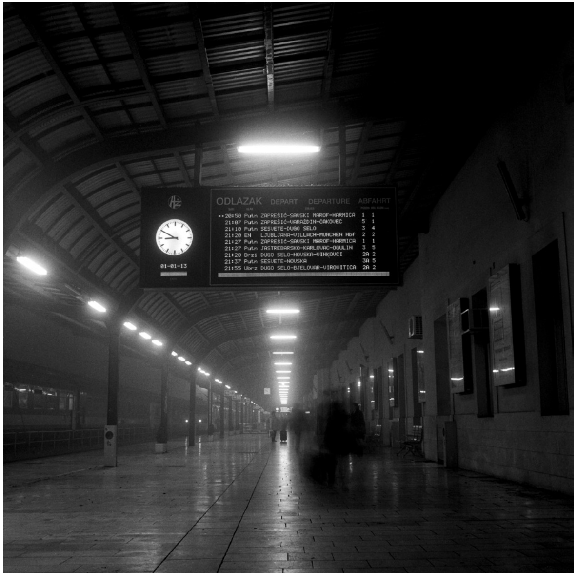
Odlazak (Glavni kolodvor)