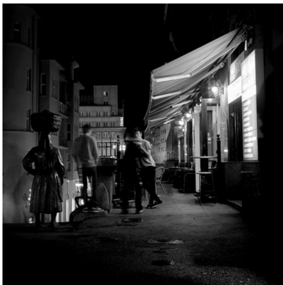
Kod kumice (tržnica Dolac)