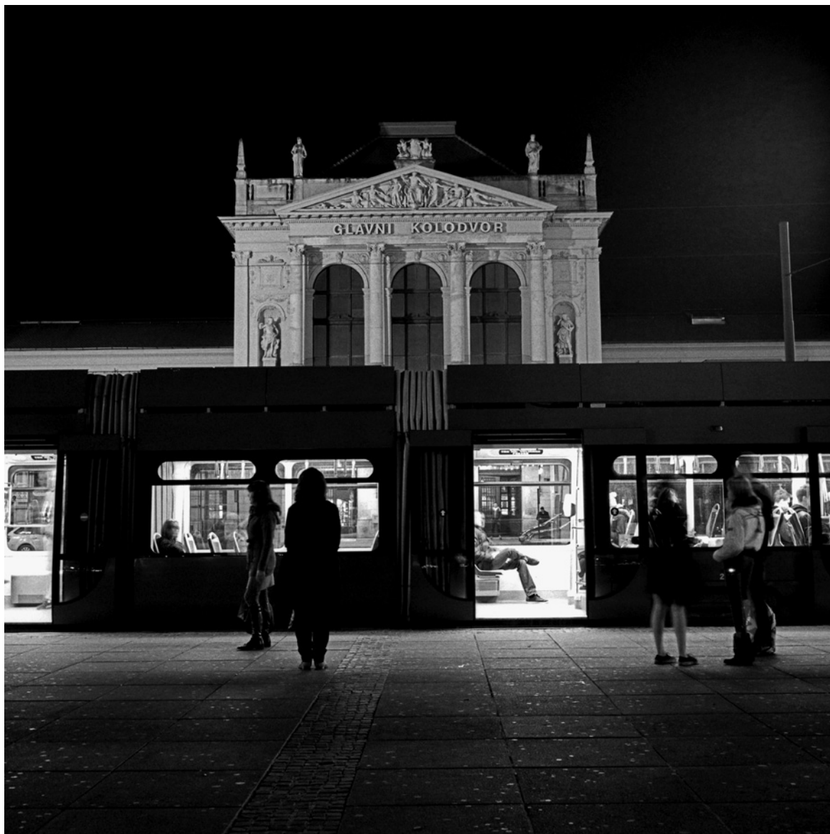
Glavni kolodvor (trg kralja Tomislava)