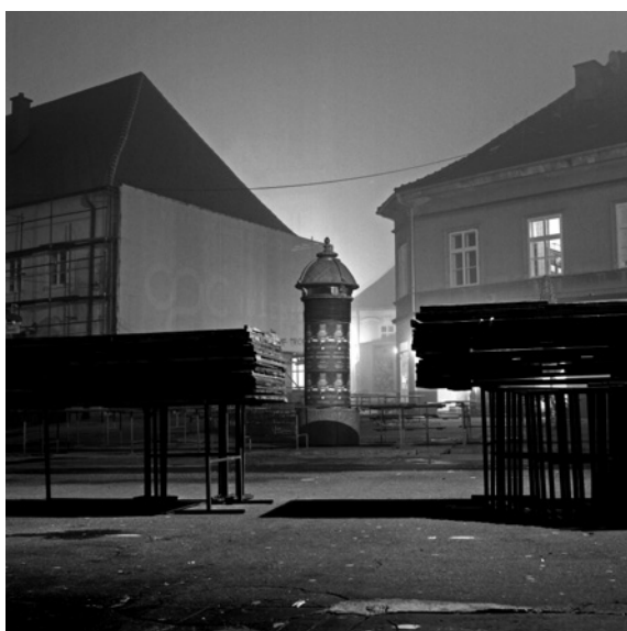
U iščekivanju jutra (tržnica Dolac)