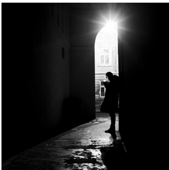
U prolazu (kolna veža prema Radićevoj ulici)