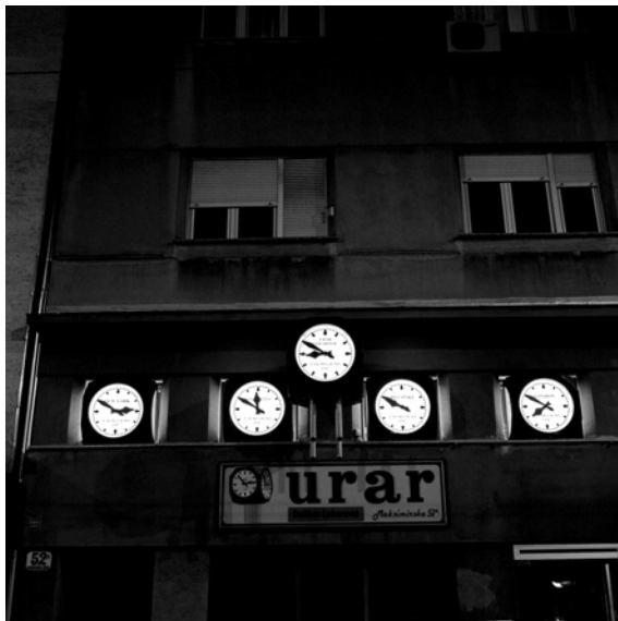
Lebarović (Maksimirska ulica)