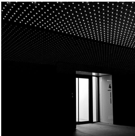
Osvjetljena vrata (Trg Europe)